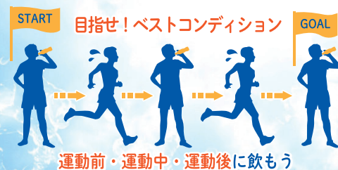
運動前・運動中・運動後に飲もう