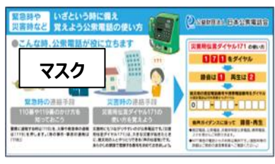
※イベント配布ツールは数に限りがあります