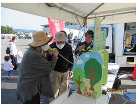
※イベント開催時期によっては、参加できない場合もあります