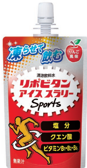
りんご風味 (無果汁)