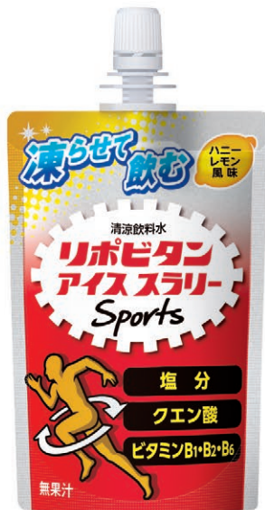
ハニーレモン風味 (無果汁)