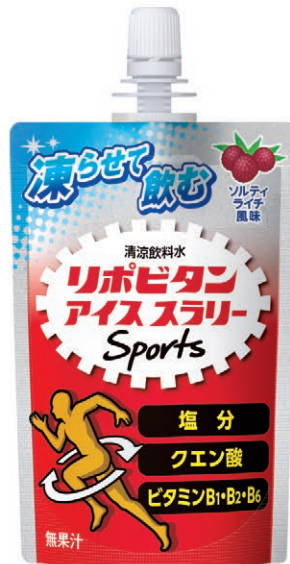
ソルティライチ風味 (無果汁)