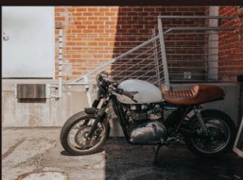
人の目の行き届きにくい場所(山林・駐車場・資材置き場など)の監視