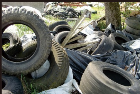
タイヤ・ゴミなどの不法投棄の監視