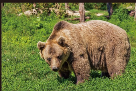
鳥獣被害対策(鹿、熊、猪などによる農作物や木材への被害)