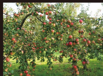
広大な敷地(ゴルフ場、田園、果樹園など)の監視