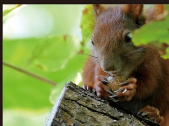
野生動物の生態観察(研究、調査、アウトドア)