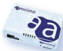
Edge Gateway amnimo G シリーズ