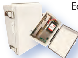
Edge Gateway 屋外用 (開発中)