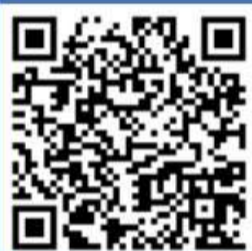
事業所用シェルター