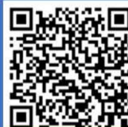
家庭用シェルター

住宅用 240,000 円 (税・配送費別途) 組立費 5,000 円 (税別) 事業所用 270,000 円 (税・配送費別途) 組立費 5,000 円 (税別)